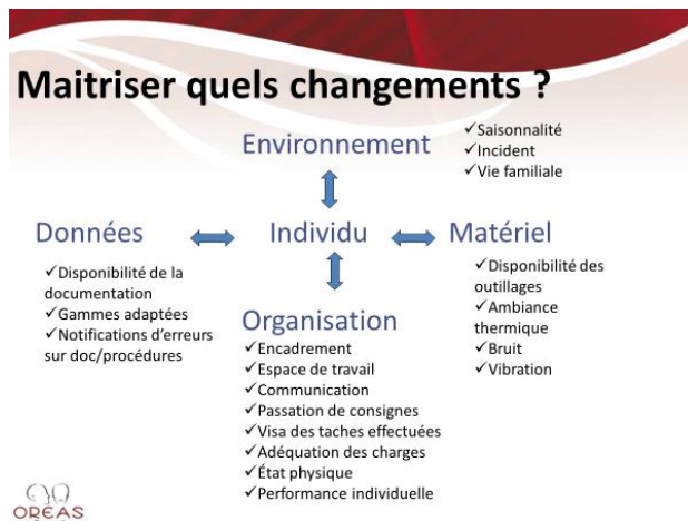
Figure 2 Modèle de prise en compte des facteurs externes

Il s'agit de la clé de voute de la démarche. Faire en sorte que l'ensemble des acteurs s'investissent. Pour cela, il faut également prendre en compte leurs perceptions, leur stress. Cette notion est un danger à intégrer dans les DUER et ils font également partie d'une source supplémentaire. Le stress induit lors d'une situation de travail est une source externe à l'exposition à un danger physique. Il augmente la probabilité de survenance d'un dommage.